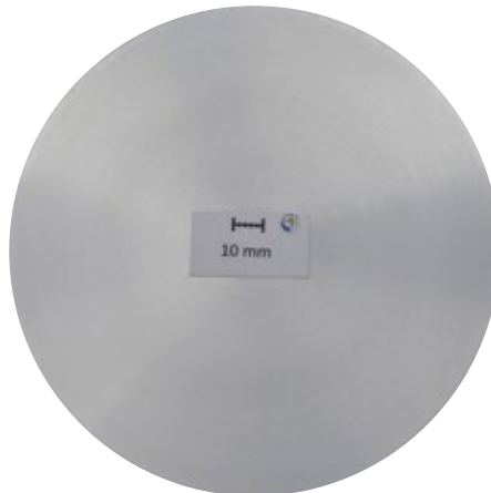
Makroschliff, d178 mm: Seigerungszone 2,9 mm

Prozessbedingt tritt an stranggegossenen Barren in der Randschicht direkt eine Seigerungszone auf. Vor der Weiterverarbeitung ist diese zu entfernen – bei Barren von LEICHTMETALL ist das bereits schon der Fall. Auf Kundenwunsch durchlaufen die abgedrehten Barren eine abschließende Qualitätsprüfung (automatische Ultraschall-Prüfung unter Wasser). Werden Gießlängen bezogen, ist die Tiefe der Seigerungszone hier beispielhaft am Durchmesser 178 mm dargestellt.