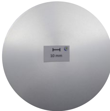
Makroschliff, d178 mm: Seigerungszone 2,1 mm

Prozessbedingt tritt an stranggegossenen Barren in der Randschicht direkt eine Seigerungszone auf. Vor der Weiterverarbeitung ist diese zu entfernen – bei Barren von LEICHTMETALL ist das bereits schon der Fall. Auf Kundenwunsch durchlaufen die abgedrehten Barren eine abschließende Qualitätsprüfung (automatische Ultraschall-Prüfung unter Wasser). Werden Gießlängen bezogen, ist die Tiefe der Seigerungszone hier beispielhaft am Durchmesser 178 mm dargestellt.