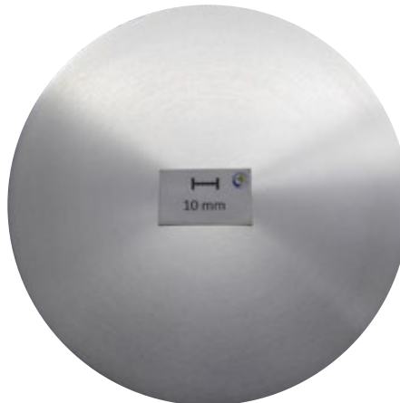
Makroschliff, d178 mm: Seigerungszone 2 mm

Prozessbedingt tritt an stranggegossenen Barren in der Randschicht direkt eine Seigerungszone auf. Vor der Weiterverarbeitung ist diese zu entfernen – bei Barren von LEICHTMETALL ist das bereits schon der Fall. Auf Kundenwunsch durchlaufen die abgedrehten Barren eine abschließende Qualitätsprüfung (automatische Ultraschall-Prüfung unter Wasser). Werden Gießlängen bezogen, ist die Tiefe der Seigerungszone hier beispielhaft am Durchmesser 178 mm dargestellt.