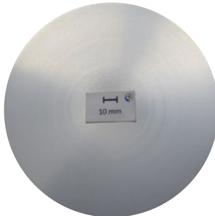
Makroschliff, d178 mm: Seigerungszone 2,7 mm

Prozessbedingt tritt an stranggegossenen Barren in der Randschicht direkt eine Seigerungszone auf. Vor der Weiterverarbeitung ist diese zu entfernen – bei Barren von LEICHTMETALL ist das bereits schon der Fall. Auf Kundenwunsch durchlaufen die abgedrehten Barren eine abschließende Qualitätsprüfung (automatische Ultraschall-Prüfung unter Wasser). Werden Gießlängen bezogen, ist die Tiefe der Seigerungszone hier beispielhaft am Durchmesser 178 mm dargestellt.