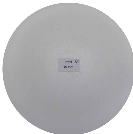
Coupe macro, d252 mm: zone de ségrégation 3,1 mm

Du fait du processus, une zone de ségrégation se forme directement dans la couche superficielle des lingots coulés en continu. Celle-ci doit être éliminée avant de poursuivre le traitement: c'est déjà le cas pour les lingots de LEICHTMETALL. Sur demande du client, les lingots tournés sont soumis à un contrôle de qualité final (contrôle automatique par ultrasons sous l'eau). Dans le cas des longueurs de coulée, la profondeur de la zone de ségrégation est illustrée ici par l'exemple d'un diamètre de 252 mm.