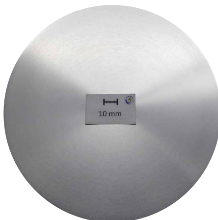
Coupe macro, d178 mm: zone de ségrégation 2 mm

Du fait du processus, une zone de ségrégation se forme directement dans la couche superficielle des lingots coulés en continu. Celle-ci doit être éliminée avant de poursuivre le traitement: c'est déjà le cas pour les lingots de LEICHTMETALL. Sur demande du client, les lingots tournés sont soumis à un contrôle de qualité final (contrôle automatique par ultrasons sous l'eau). Dans le cas des longueurs de coulée, la profondeur de la zone de ségrégation est illustrée ici par l'exemple d'un diamètre de 178 mm.